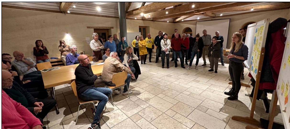
Fig. 2 : Phase de restitution des propositions