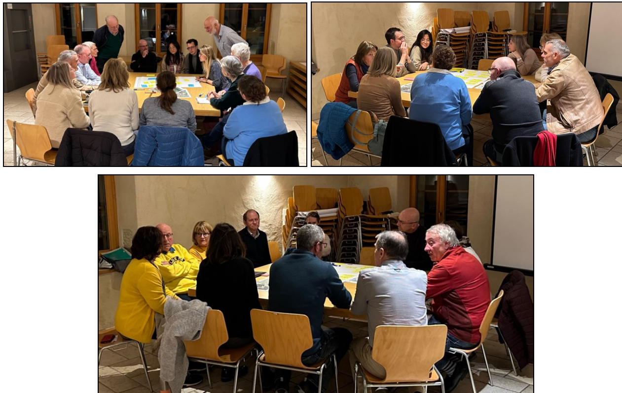
Fig. 1 : Ateliers en cours

Les idées et remarques de chacun ont été notées sur des posters et présentées à l'ensemble des participants, avant d'être priorisées par ceux-ci via un vote.